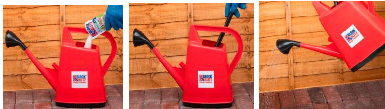
Hæld granulat i vand